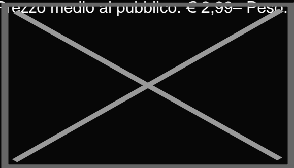
Big Burger - Veggies Burger

Prezzo medio al pubblico: € 2,99 – Peso: 200 grammi (2 Beef Burger in ogni confezione).