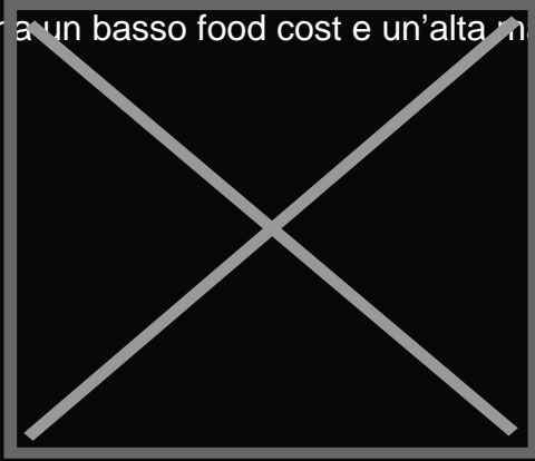
Mousse allo zenzero, lime e menta

Il Sorbetto Base Neutra è senza glutine, ideale per creare un'infinità di gusti diversi di sorbetto in base alla stagionalità e ai trend del momento. Di semplice e immediata preparazione a freddo all'interno di frozen machine, sorbettiera, pacojet e mantecatore, è stabile agli sbalzi di temperatura e da pronto può essere conservato in congelatore. Disponibile in confezioni da 1 kg, elimina gli sprechi, ha un basso food cost e un'alta marginalità.