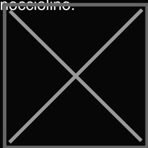
Coffee Jockey (Macchina OCS)

In occasione di Venditalia Caffè Moak lancia inoltre la linea di capsule dedicate al settore OCS e Vending compatibili con i sistemi MPS e IES: Tre pregiate miscele di caffè della linea My Music; forte Rock, aromatico Jazz, e Classic decaffeinato. Oltre a Tè al limone, caffè al ginseng, orzo e nocciolino.