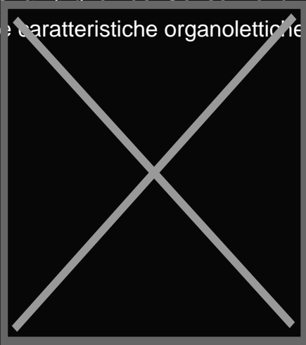
Pizza "Metodo a doppia lievitazione"

A questo aspetto si somma la qualità del topping, di un'ingredientistica che da anni l'azienda arricchisce e perfeziona selezionando le migliori materie prime presenti sul territorio . Esempio di questa capacità di ricerca è l'utilizzo su varie referenze della gamma Re Pomodoro degli Champignon del Consorzio funghi di Treviso che grazie al processo di brasatura mantengono intatte le caratteristiche organolettiche sprigionando tutto il loro sapore.