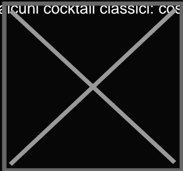
FAMILY PLUM MANHATTAN

Il California Prune Board ha pertanto presentato 3 creazioni insolite e sorprendenti grazie al 1930 Cocktail Bar di Milano, uno degli speakeasy più trendy d'Europa, che ha contribuito alla rivisitazione di alcuni cocktail classici: così sono nati il Family Plum Manhattan, il California Nation e lo Slow Chaplin.