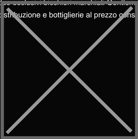
JACK DANIEL'S SINGLE BARREL - Jack Daniel's Single

Il Natale 2017 di Gentleman Jack si festeggia con un'elegante confezione speciale, pensata per esaltarne raffinatezza ed unicità. La classica bottiglia da 70cl è inserita in un special pack contenente due esclusivi bicchieri marchiati Gentleman Jack, disponibile presso le principali catene della grande distribuzione e bottiglierie al prezzo consigliato di 24,00 euro .